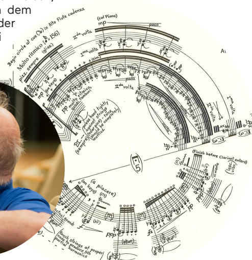
Photo: George Crumb

A shy, yet warmly eloquent personality, Crumb retired from his teaching position at the University of Pennsylvania after more than 30 years of service. Honored by numerous institutions with honorary Doctorates, and the recipient of dozens of awards and prizes, Crumb makes his home in Pennsylvania, in the same house where he and his wife of more than 60 years raised their three children. George Crumb's music is published by C.F. Peters and an ongoing series of „Complete Crumb“ recordings, supervised by the composer, is being issued on Bridge Records.