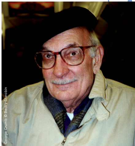
George Crumb